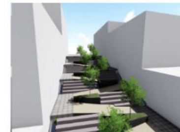
CANAL ABIERTO CON DISIPADOR TIPO ESCALONADO